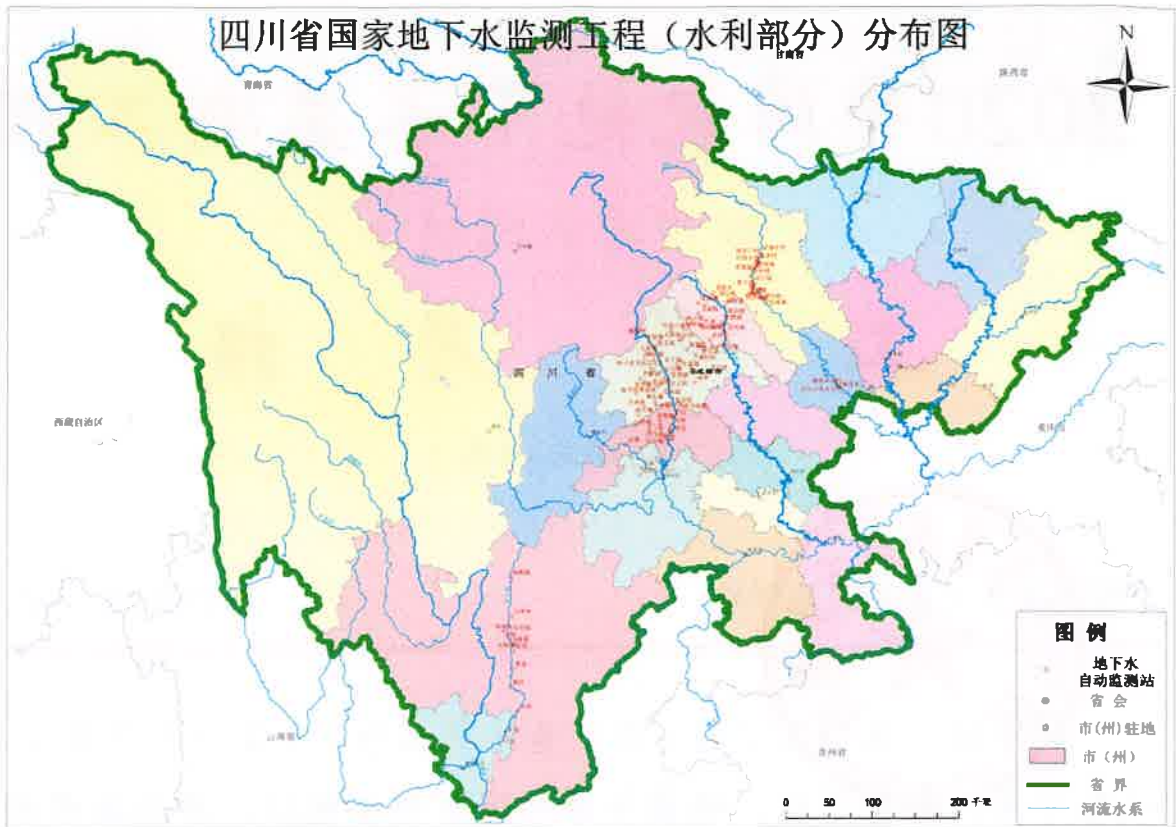
图1 国家地下水监测工程（四川省水利部分）分布图

水位：本月水位自动监测的数据到报率为98.4%，与11月持平。广元局、乐山局和凉山局到报率均上升至100%，其余到报率均大于95%，和上月对比，德阳局、广元局、乐山局和绵阳局下跌，成都局、凉山局和眉山局上升，其余局与上月基本持平，11月份全省对15测站进行了维修，校测34站。1-11月到报率情况见表3和图3。