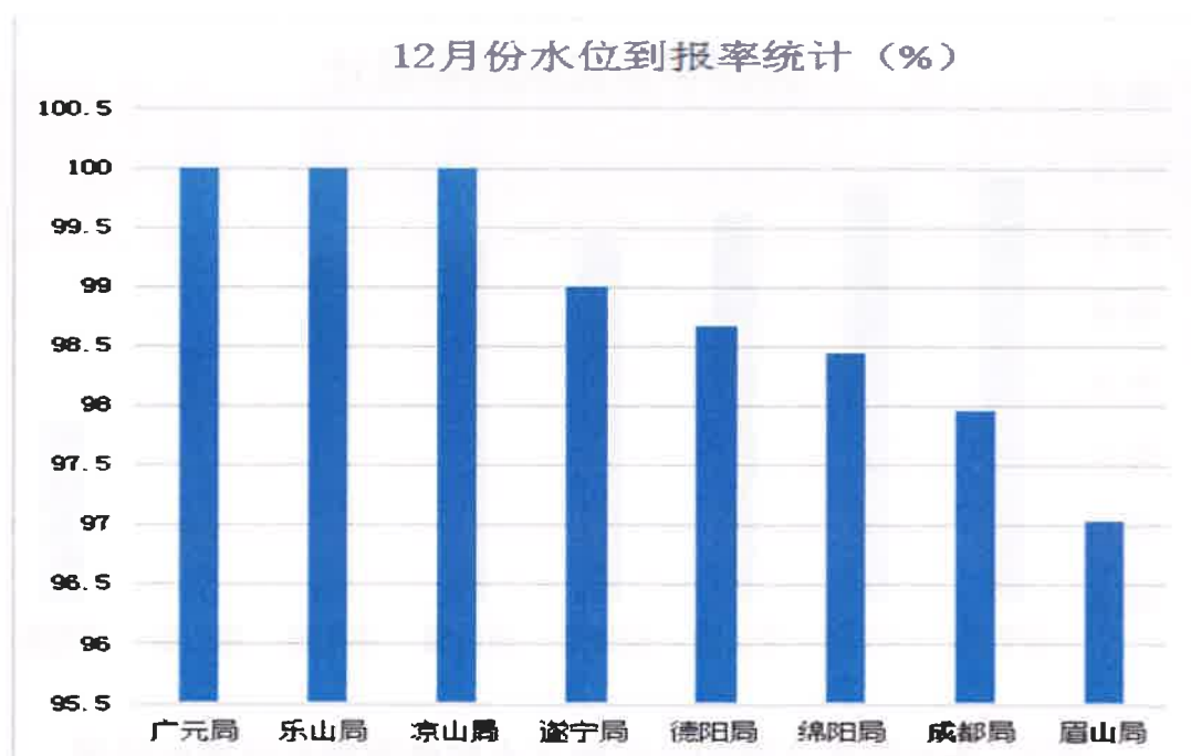
图2: 各地区水文局12月地下水监测数据到报率柱状图