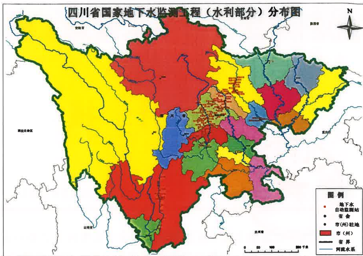
图1 国家地下水监测工程（四川省水利部分）分布图

水位：本月水位自动监测的数据到报率为99.3%，比6月相比1略有下降。全省广元、绵阳、攀枝花、遂宁到报率为100%，除绵阳局略有上升外，眉山、德阳、成都、凉山和乐山均有下降。7月份全省对6测站进行了维修，对4站进行了校测工作。到报率情况见表2和图2到表3和图3。